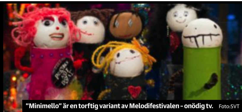
"Minimello" är en torftig variant av Melodifestivalen – onödig tv.

Sickla Köp kvarter & Sveavägen 34 • Stockholm www.ohlssonstyger.se