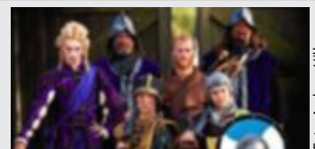
en välfärdigt populär serie med många säsonger bakom sig. Foto: Andreas Hillergren Andreas Palmaer

Det är rollspel i tv med barnen som huvudpersoner. "Barda" är